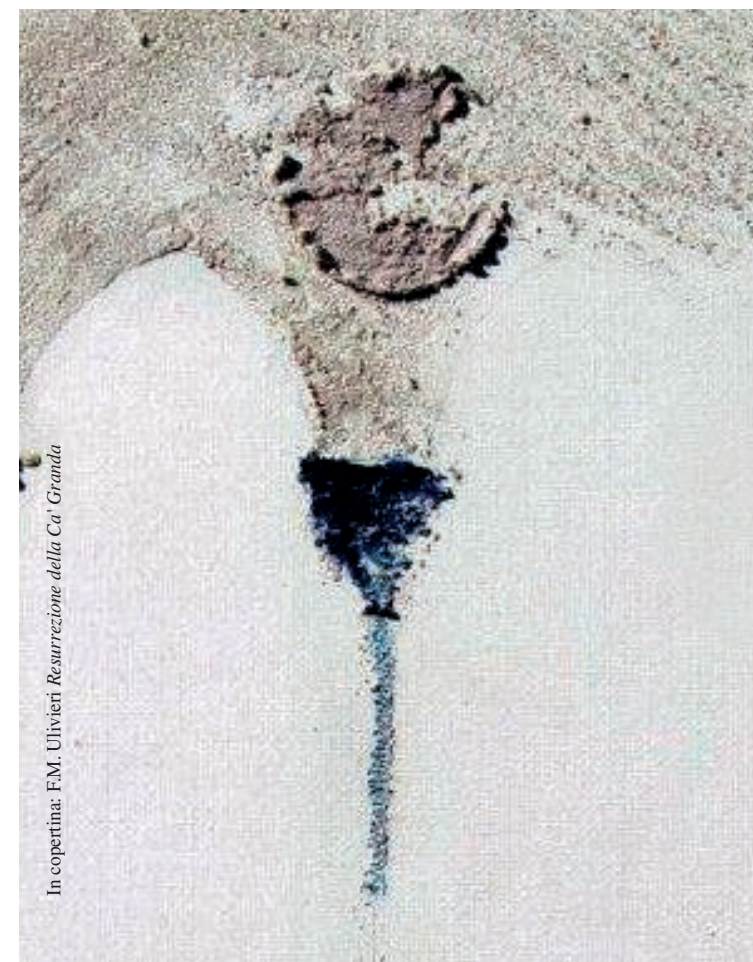
In copertina: F.M. Olivieri Resurrezione della Ca' Granda